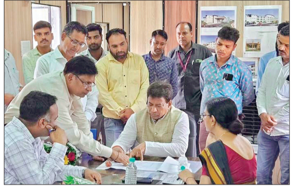
आष्टा। विधायक ने निरीक्षण कर अधिकारियों से की चर्चा।