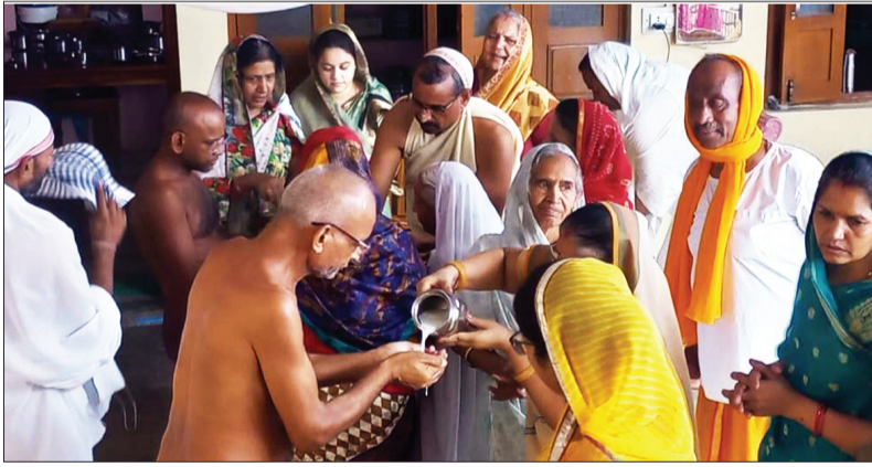
एवं सकल दिगंबर जैन समाज मेहतवाड़ा ने मिलकर महाराज का स्वागत किया।