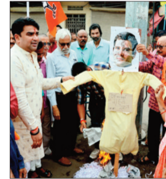
बताने वाले बयान पर विरोध प्रदर्शन करते हुए

सीहोर। लोकसभा में नेता प्रतिपक्ष कांग्रेस नेता राहुल गांधी द्वारा हिंदुओं को हिंसक बताने वाला बयान दिया था। इसको लेकर पूरे देश में राहुल गांधी का विरोध हो रहा है। शहर के कोतवाली चौराहे पर भाजपा नगर मंडल के तत्वावधान में भाजपा कार्यकर्ताओं और क्षेत्रवासियों ने राहुल गांधी के खिलाफ प्रदर्शन करते हुए मुर्दाबाद के नारे लगाए। साथ ही उनका पुतला फूंककर इस मामले में माफी मांगने की मांग की है।