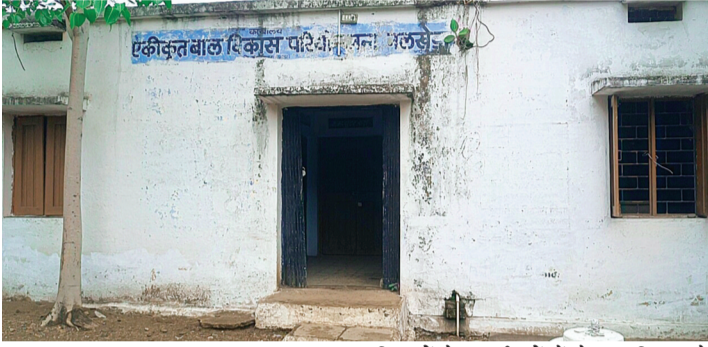
सरकार द्वारा समस्त शासकीय विभागों के कार्यालयों में अधिकारियों व कर्मचारियों को लगता है सरकार कोई भी आदेश निकाल दे अधिकारी-कर्मचारी अपने हिसाब से ही कार्यालय पहुंच रहे हैं, जिससे शासन के आदेश हवा हवाई होते दिखाई दे रहे हैं।

शासन द्वारा समस्त शासकीय कार्यालयों का समय सुबह 10 से सायं 6 बजे तक का किया गया है। लेकिन तहसील मुख्यालय पर लगभग सभी कार्यालयों में अधिकांश अधिकारी-कर्मचारी तय समय 10 बजे नहीं पहुंच रहे हैं। यहाँ तक की कई कार्यालयों में कक्षों के ताले भी नहीं खुल रहे हैं। ऐसा लगता है सरकार कोई भी आदेश निकाल दे अधिकारी-कर्मचारी अपने हिसाब से ही कार्यालय पहुंच रहे हैं, जिससे शासन के आदेश हवा हवाई होते दिखाई दे रहे हैं।