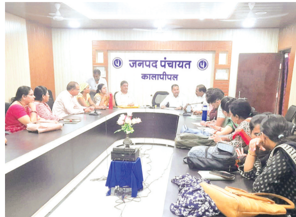
हरिभूमि न्यूज ॥ कालापीपल

बैठक में कई बिंदुओं पर चर्चा हुई जनपद में महिला बाल विकास विभाग की बैठक आयोजित