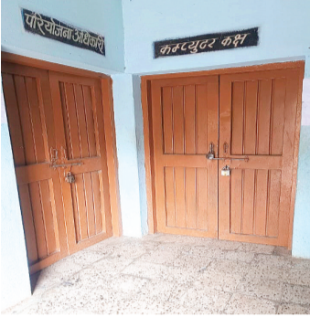
हरिभूमि न्यूज | नलखेड़ा